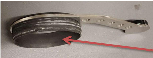
Abb. Anschluss der Uhr

Den Gummispannung in den Halter montieren ggf. im inneren etwas leicht Creme einschmieren , dann rutscht es besser über das Uhrengehäuse.